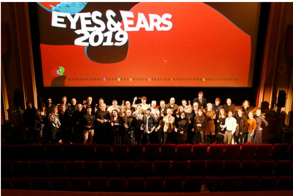
Preisträger der 21. Internationalen Eyes & Ears Awards

Direkt im Anschluss an die Eyes & Ears Awards-Verleihung fand die EYES & EARS Party im Cafe Cord statt. Bei Getränken und guter Musik konnten die Teilnehmer der EYES & EARS den Tag stimmungsvoll ausklingen lassen, die Preisträger feiern, sowohl neue Kontakte knüpfen als auch alte Bekannte treffen und Pläne für neue Projekte schmieden. Wir freuen uns jetzt schon auf die EYES & EARS 2020 mit den 22. Internationalen Eyes & Ears Awards!