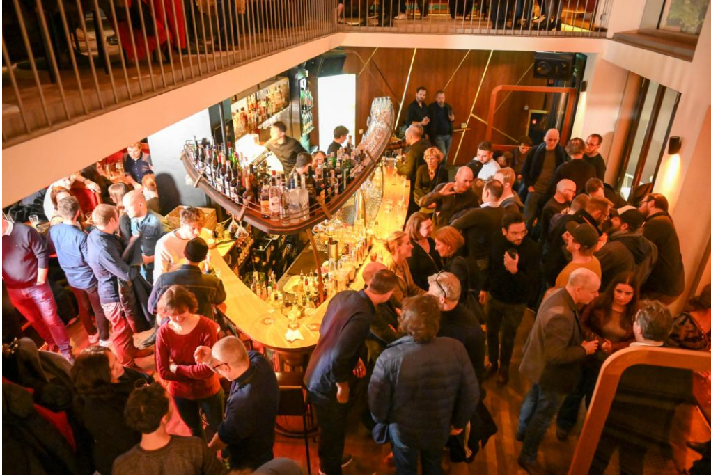
After Award-Party im Cafe Cord

Preisträger und Jurybegründungen der 21. Internationalen Eyes & Ears Awards: https://eeofe.org/de/kalender/eyes-ears/2019/awards/preistraeger/design/