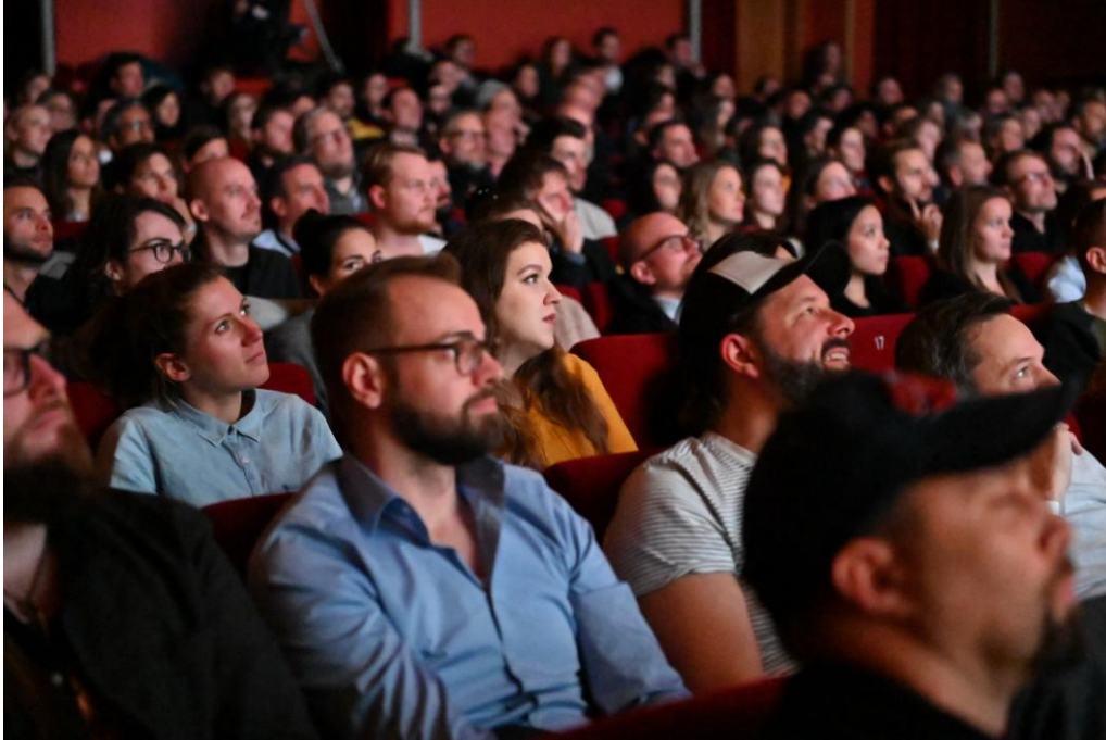
Publikum der Eyes & Ears Awards-Show

Moderiert wurde die kurzweilige Show im voll besetzten Filmtheater Sendlinger Tor in bewährter Leichtigkeit von Wolfram Kons. Diesmal hatte er zudem eine besondere Aufgabe: Während des Pausenbreaks, dem "RTL Beer Break Bingo", ließ er die RTL-Kultsendung "Der Preis ist heiß" aufleben. Er moderierte das Bingo-Spiel, bei dem es per Los-Trommel sogar reale Preise – von einem Staubsauger über einen Toaster bis hin zu einem Fernseher – zu gewinnen gab. So sorgte RTL für eine launige Unterbrechung.