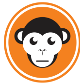
MEDIA APES GMBH